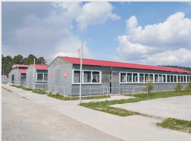
Пункт хозяйственного довольствия