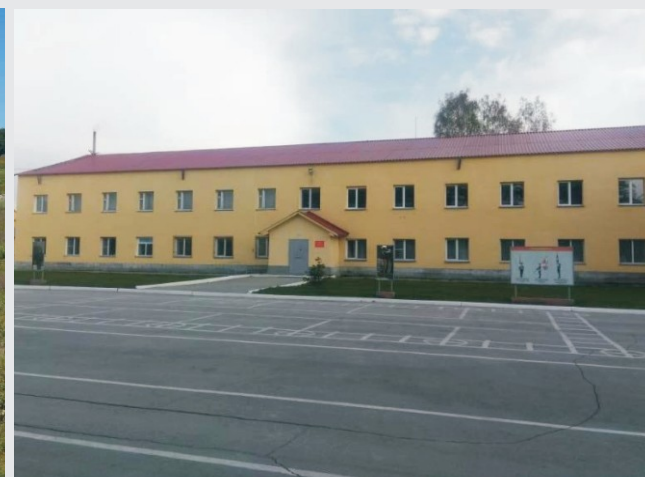
Казарма учебного центра

Прибывших абитуриентов регистрируют, проверяют результаты ЕГЭ и распределяют по взводам (по 30 человек). Абитуриентский сбор и вступительные испытания проходят в учебном центре военного института в г. Искитим.